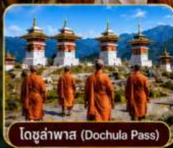
โดจุล่ำพาส (Dochula Pass)