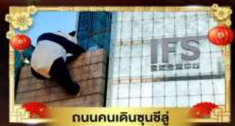
ถนนคนเดินชุนชี่อู่

เที่ยวอุทยานสวรรค์ระดับ 5A จิวจ้ายโกว "กู๋เขาสีดรุณี" อุทยานชื่อดังเหนียงชาน