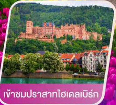
เข้าชมปราสาทไฮเดิลเบิร์ก