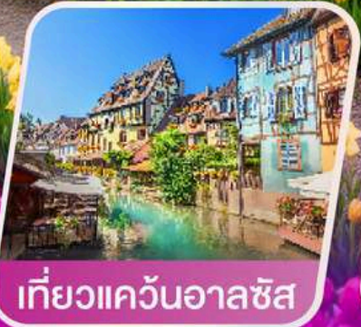
เที่ยวแคว้นอาลซัส