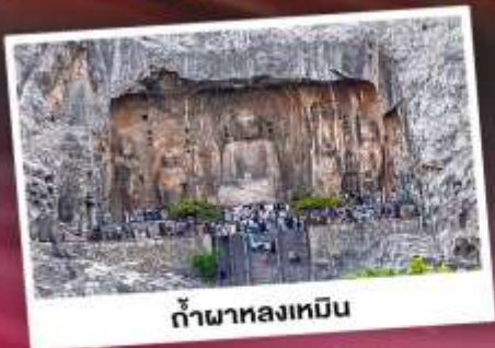
ถ้ำผาหลงเหมิน