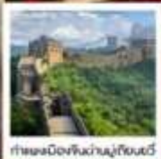
กำแพงเมืองจีน/ห่านคู่เทียนอัน