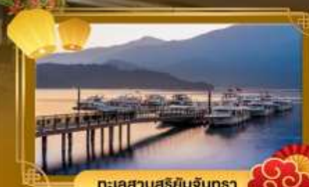
ทะเลสาบสุริยอินจันทรา