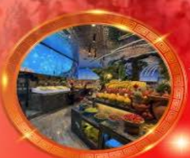
บุฟเฟต์หม้อไฟลงซีง