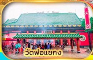
วัดพ่อแชกง