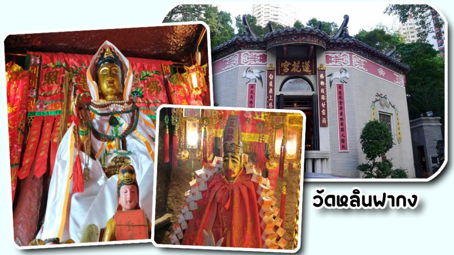
วัดหลินฟาง

นอกจากนี้ทางวัดหลินฟ้าก็ยังมี เทพเจ้าสาวจ้อเฮียะ หรือเทพเจ้าสายนรก เป็นเทพเจ้าที่ขึ้นชื่อเรื่องกตัญญูที่มาในรูปแบบลักษณะการรุ่มง่าม ผ่าดิบ ซึ่งเป็นสัญลักษณ์ของการไว้ทุกข์ที่คนเชื้อสายจีนให้ความสำคัญ เทพเจ้าองค์นี้ก็เปี่ยมไปด้วยพลังหยิน ซึ่งเป็นด้านเกี่ยวกับเงินทองของ สำหรับผู้ที่ชอบเสี่ยงโชค