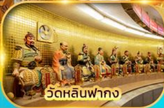
วัดหลินฟาถง