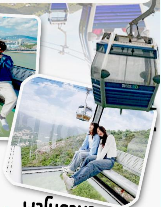
พานิราม่า