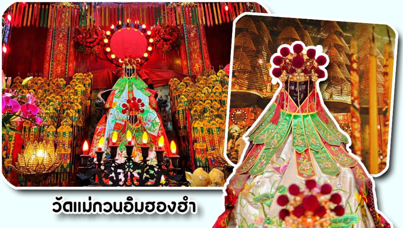
วัดแม่กวนอิมสองฮ้า

จากนั้นพาท่านเข้าไปไหว้ขอพร วัดแม่กวนอิมสองฮ้า วัดเก่าแก่ของฮ่องกงสร้างตั้งแต่ปี ค.ศ .1873 เป็นวัดขนาดเล็กที่มีชาวฮ่องกงศรัทธา นับถือกันเป็นอย่างมากวัดแห่งนี้เป็นที่ประดิษฐาน องค์เจ้าแม่กวนอิมสองฮ้า ที่มีชื่อเสียงเรื่องการให้กู้ยืมเงินเชื่อกันว่าท่านช่วยพลิกฟื้นเศรษฐกิจของชาวฮ่องกง ผู้คนจึงนิยมมาเยี่ยมเงินทำธุรกิจจนสำเร็จ ร่ำรวย รุ่งเรืองโดยให้ท่านอธิษฐานขอพรต่อหน้า เจ้าแม่กวนอิมสองฮ้าพร้อมกับระบุวันเวลาในการขอพรด้วย จากนั้นนำธูปธูปตามฐานะและศรัทธาที่เราจะนำเป็นสื่อในการขอพร เขียนจำนวนเงินที่ต้องการลงไปด้วย ใส่สกุลเงินยิ่งดีใหญ่ แล้วนำเงินใส่ในซองแดง ควรเตรียมซองแดงไปเอง นำซองแดงไปวนรอบกระถางธูป วนขวาจำนวน 3 ครั้ง แล้วเก็บซองแดงในกระเป๋าสตางค์ เป็นเงินขวัญถุง ถ้าประสบความสำเร็จตามที่มุ่งหวัง ให้นำเงินในซองแดงทำบุญหยอดตู้ที่วัดแห่งนี้ในโอกาสต่อไป