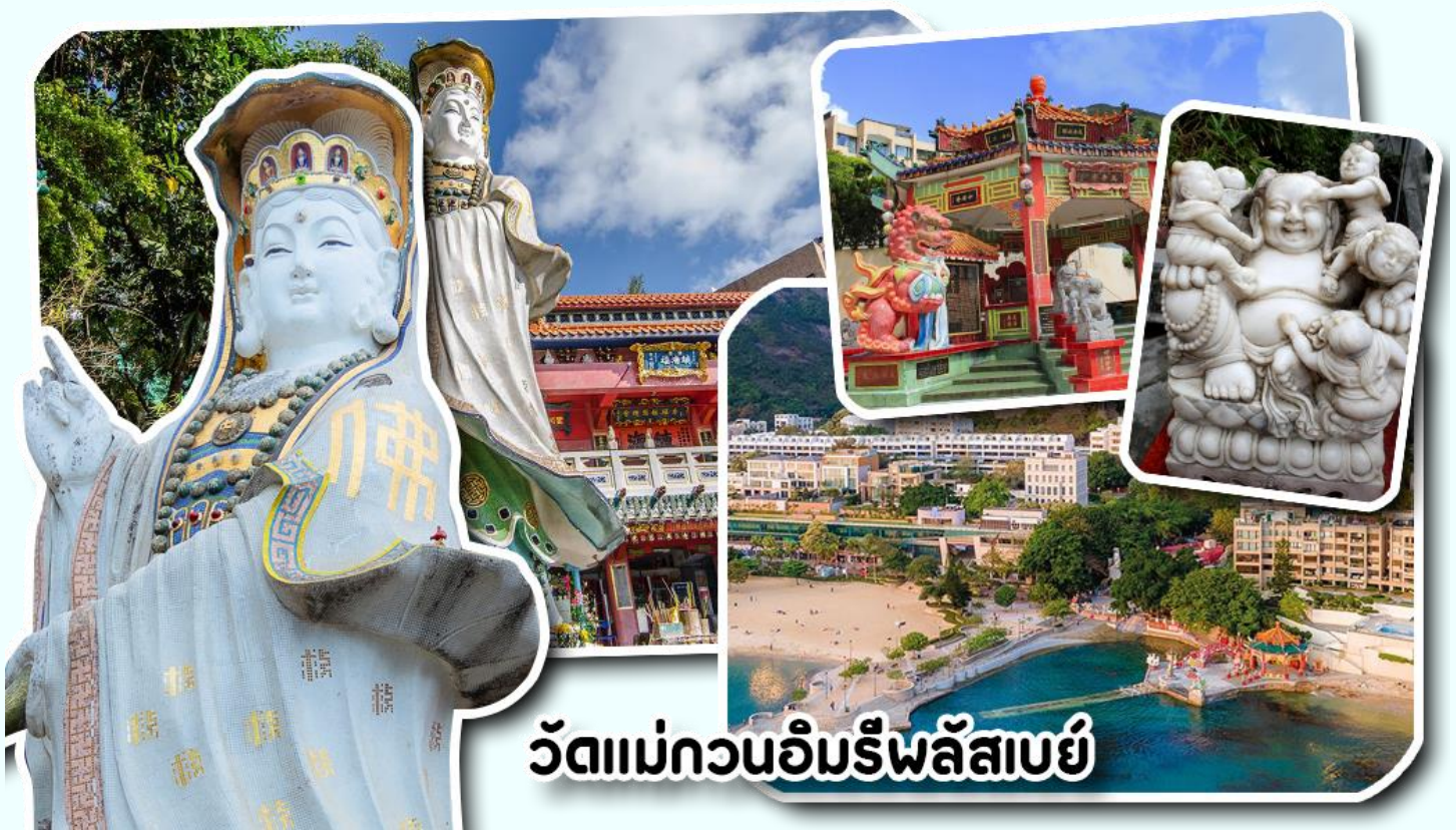
วัดแม่กวอนอิมรีพลัสเบย์

จากนั้นพาท่านเดินทางไปนมัสการ เจ้าแม่กวอนอิมรีพลัสเบย์ วัดแห่งนี้ถูกสร้างขึ้นเพื่อคุ้มครองชาวประมงเวลาออกเรือไปหาปลาในสมัยก่อน บริเวณวัดมีสิ่งศักดิ์สิทธิ์มากมาย ได้แก่ เจ้าแม่กวอนอิม ประดิษฐานอยู่ทางด้านซ้ายของวัด ซึ่งผู้คนนิยมเดินทางไปกราบไหว้ขอพรเรื่องการมีบุตร และยังมีพระสังกัจจายที่เชื่อกันว่าสามารถขอเพศของบุตรที่จะมาเกิดได้ โดยหลังจากกราบไหว้แล้วก็ให้ลูบที่ท้องของพระสังกัจจาย ถ้าอยากได้ลูกชายให้ลูบท้องซ้าย อยากได้ลูกสาวให้ลูบท้องขวา ถัดมาคือ เจ้าแม่ทับทิมเทพีแห่งท้องทะเล ท่านจะคอยคุ้มครองผู้เดินทางทางเรือ หรือผู้ที่เดินทางไปไหนมาไหนท่านจะคอยคุ้มครองให้ปลอดภัย และมีโชคลาภ ถัดจากบริเวณที่กราบไหว้ขอพร ก็จะมีศาลาแปดเหลี่ยมริมน้ำ และสะพานเล็กๆ ที่ชื่อว่าสะพานต่ออายุ ซึ่งเชื่อกันว่าหากเดินข้ามสะพานแห่งนี้ 1 ครั้ง ก็จะมีอายุยืนขึ้น 3 ปี