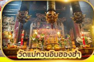
วัดแม่กวนอิมสองข่า