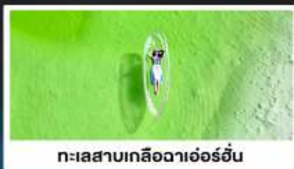
ทะเลสาบเกลือดาเอ๋อร์อัน