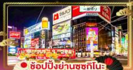
• ช้อปปิ้งย่านซุกุชิโนะ