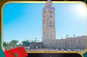
มัสยิดคูตูเบีย มาราเกช

หมู่บ้านเซฟซาอูน • หอคอยอัลซัน • ป้อมอูดายาส • สุเหร่าไครเวิน • สุสานบูเลย์ อีสมาลิล • จัตุรัสมาออลฟา • อัตเบนฮัดดู • ป้อมทากูริก • ย่านฮูบัส • จัตุรัสโมอัมเหมิดที่ 5