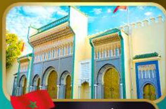
ประตูพระราชวังหลวง