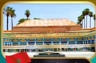
พระราชวังบาเอีย