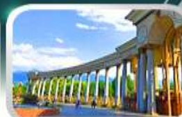
1st President Park