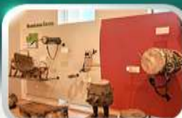
Museum of Folk Instrument