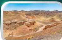
ชารินแกรนด์แคนยอน