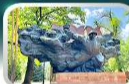
Panfilov Guardsmen Park