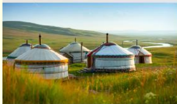
กุ่มหล่าออร์ดอส