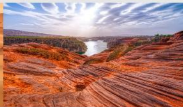
อุทยานหุบเขาคีลิน

*ทางบริษัทฯ ขอสงวนสิทธิ์ในการสลับโปรแกรมทัวร์ตามความเหมาะสมขึ้นอยู่กับสถานการณ์หน้างาน โดยคำนึงถึงผลประโยชน์ของลูกค้าเป็นสำคัญ