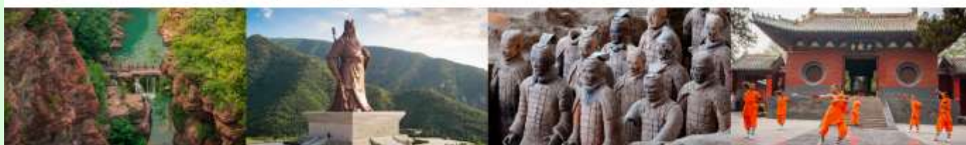
อุทยานสวรรค์หยุนโตซาน