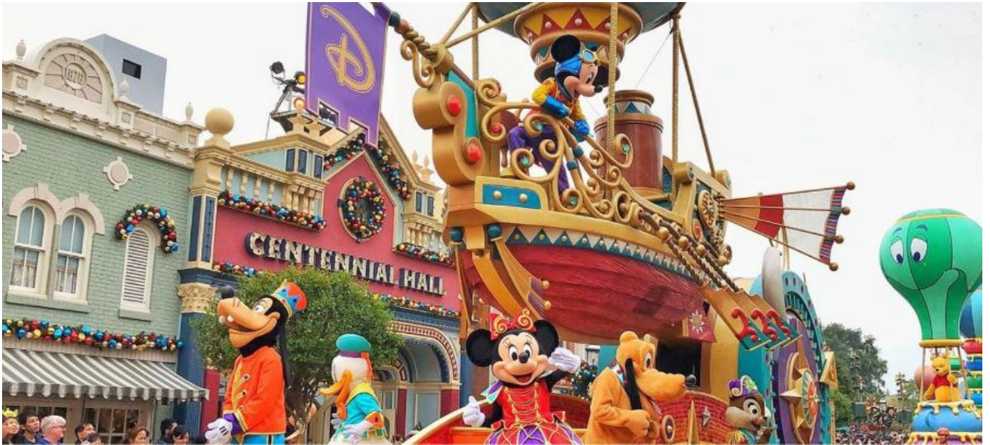
King, Toy Story

ชมขบวนพาเหรด ไฟลท์ส ออฟ แฟนตาซี โดยสามารถชมขบวนพาเหรดได้ที่เมนสตรีท ยูเอสเอ (การแสดงอาจจะมี การยกเลิกขึ้นอยู่กับสภาพอากาศ) ชมความน่ารักและเชียร์ตัวละครดิสนีย์ ที่ร่วมขบวนมากมายไม่ว่าจะเป็นตัวการ์ตูน ดัง อาทิ Mickey mouse, Minnie mouse, Winnie and the Pooh ตามด้วยเจ้าหญิงแสนสวยจากนิทานหลากหลาย เรื่อง อาทิ Snow White, Rapunzel, Cinderella หรือตัวละครจากภาพยนตร์ดัง อาทิ The Jungle Book, The Lion