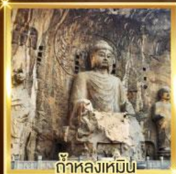
ถ้ำหลงเหมิน