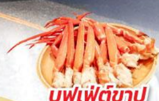
บุฟเฟ่ต์ซาซิมิ

ชมความงามของกำแพงหิมะ เส้นทางสายอัลไพน์ ทาเคยาม่า ฟูจิ ซิบะ ซากุระ เฟสติวล (Pinkmoss)