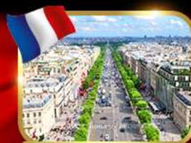
เดินเล่นย่านช็องเซลีซ