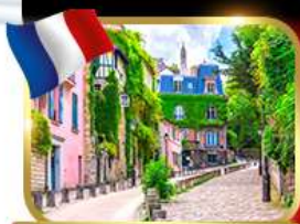
Rue de l'Abreuvoir มงมาร์ต