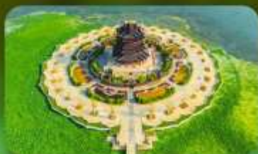
วัดฉงหยวน