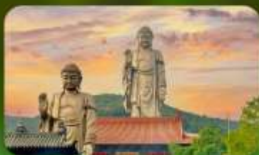
พระใหญ่หลิงชาน