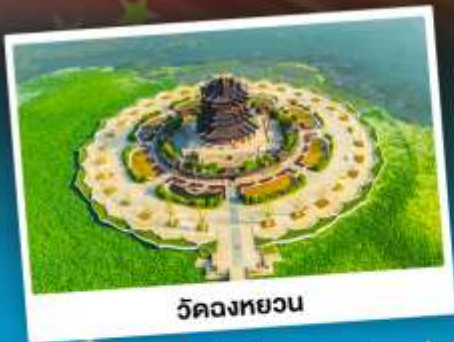
วัดทองยวน