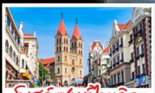
โบสถ์เซนต์ไมเคิล