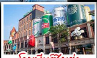
ริ่งเป็ยริ่งชิงเต่า