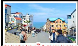
ถนนคอปเพิลิงหมายเลข 8

สัมผัสความยิ่งใหญ่ของ 4 เมืองสำคัญ ชิงเต่า - เยียนโก - เฟิงไฮล - เว่ยไห่ ปาต้ากวน - โบสถ์คาทอลิก - ตึกเก่าริมหา