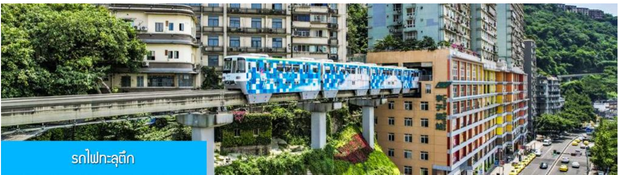
รถไฟทะลุตึก