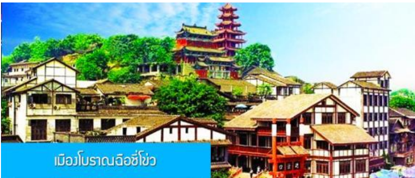
เมืองโบราณฉือชิว

พักที่ HOLIDAY INN EXPRESS HOTEL โรงแรมระดับ 4 ดาวหรือเทียบเท่าในเมืองจิว