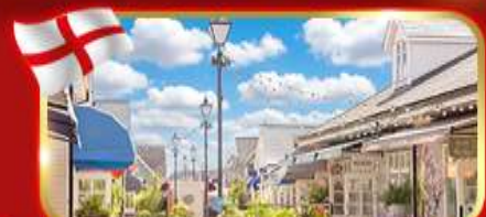
ช้อปปิ้งเอาท์เล็ต Bicester village