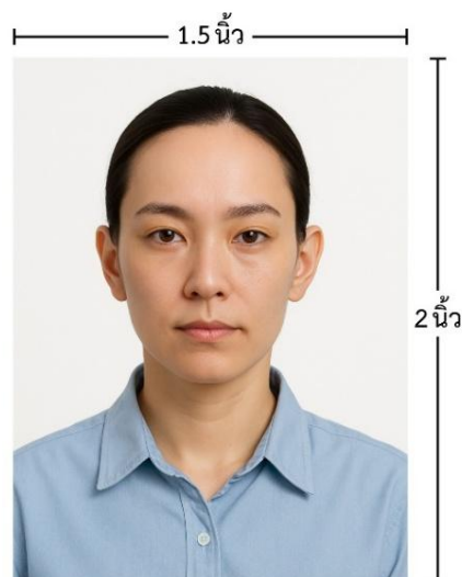
ขนาดรูปตัวอย่างใช้ยื่น Visa

*** ห้ามขีดเขียน แม็ก หรือใช้คลิปลวดหนีบัตรค้าย ซึ่งอาจส่งผลให้รูปถ่ายชำรุด และไม่สามารถใช้งานได้ ***