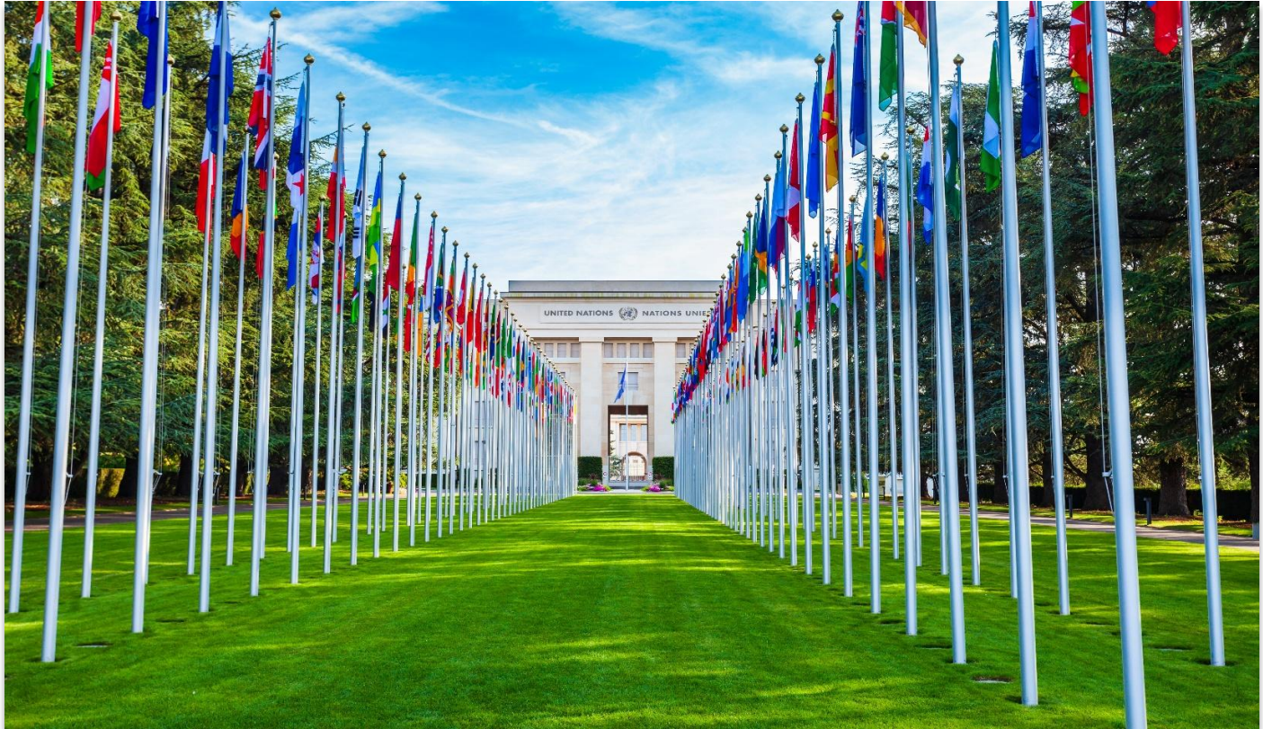
UNITED NATIONS OF GENEVA

สหประชาชาติ เจนีวา (United Nations of Geneva) เป็นหนึ่งในสำนักงานภูมิภาคที่สำคัญขององค์การสหประชาชาติ ตั้งอยู่ภายในอาคาร Palais des Nations ใจกลางนครเจนีวา ประเทศสวิตเซอร์แลนด์ อาคารแห่งนี้มีสถาปัตยกรรมแบบโรมันประยุกต์ (Neoclassical) อันโดดเด่น สร้างขึ้นในช่วงต้นคริสต์ศตวรรษที่ 20 เพื่อเป็นที่ทำการของ องค์การสันนิบาตชาติ (League of Nations) ซึ่งเป็นองค์กรระหว่างประเทศรุ่นก่อนของ