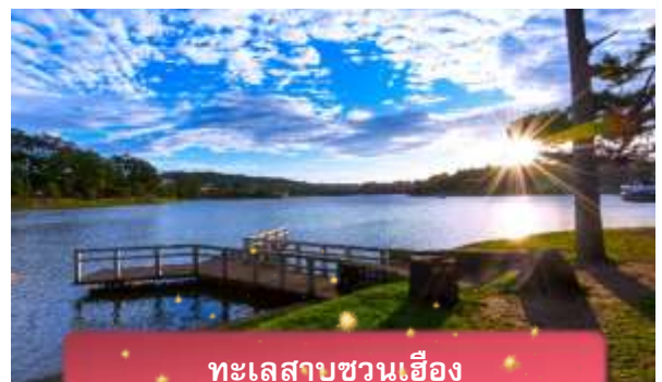
ทะเลสาบชวนเอื้อง

ที่พัก The Western Hill ระดับ 4 ดาวหรือเทียบเท่า