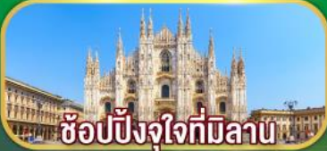
ซ็อบบิงจุงใจที่มิลาบ

เดินทาง 07-14 เม.ย. 69 / 02-09 พ.ค. 69 27 พ.ค. - 03 มิ.ย. 69 / 17-24 มิ.ย. 69 22-29 ก.ค. 69 / 11-18 ส.ค. 69 16-23 ก.ย. 69