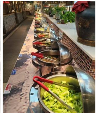
ที่พัก REZEN SUNGO HOTEL หรือระดับเทียบเท่า 4 ดาว(มาตรฐานจีน)