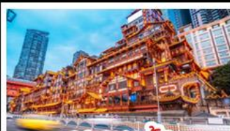
เฉิงเฉิงเฉิง

อุทยานหลุมบ่อฟ้า - อุทยานเขานางฟ้า หงหยาดัง - นังรถไฟทะเลตุ๊ก - อุทยานสีดรุณี ปี้เฉิงโกว - สะพานหนานเฉียว