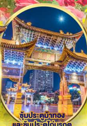
ชมประติมากรรม และ ชมประตูโถงมรกต