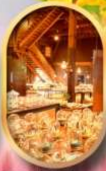
พิพิธภัณฑ์ถ้ำลอดดนตรี