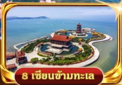
8 เซียนข้ามทะเล