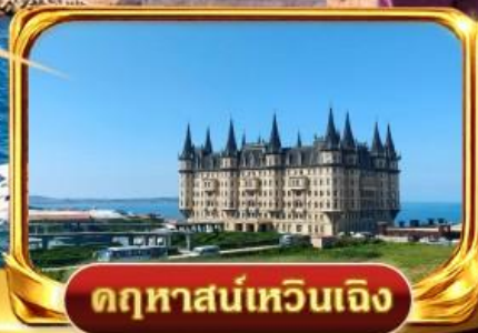
ดุหาสน์เหวินเจิง