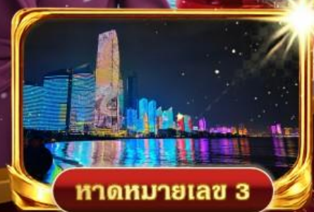
หาดหมายเลข 3