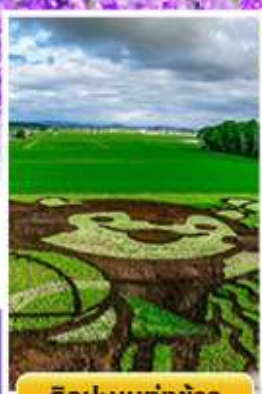
ศิลปะบนทุ่งข้าว