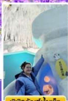
พิพิธภัณฑ์น้ำแข็ง