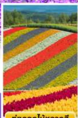
ทุ่งดอกไม้หลากสี