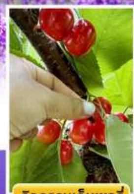
กิจกรรมเก็บเชอร์รี่

☁️ ออนเซ็น 2 คืน 🧳 นน.กระเป๋า 23 กก. 1ใบ ☀️ 6Days 4Night