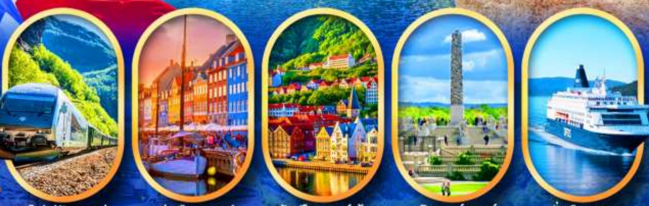
รถไฟฟลิมสขาน่า ท่าเรือฮาวน์ พักเมืองเบอร์เก็น วิกเกอร์แลนด์ นั่งเรือ DFDS