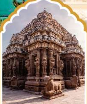
กาญจนาภิรมย์