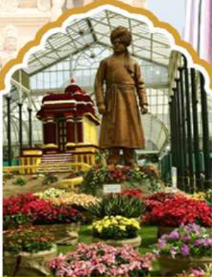
บังกาลอร์