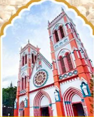
ปอนดีเชอร์