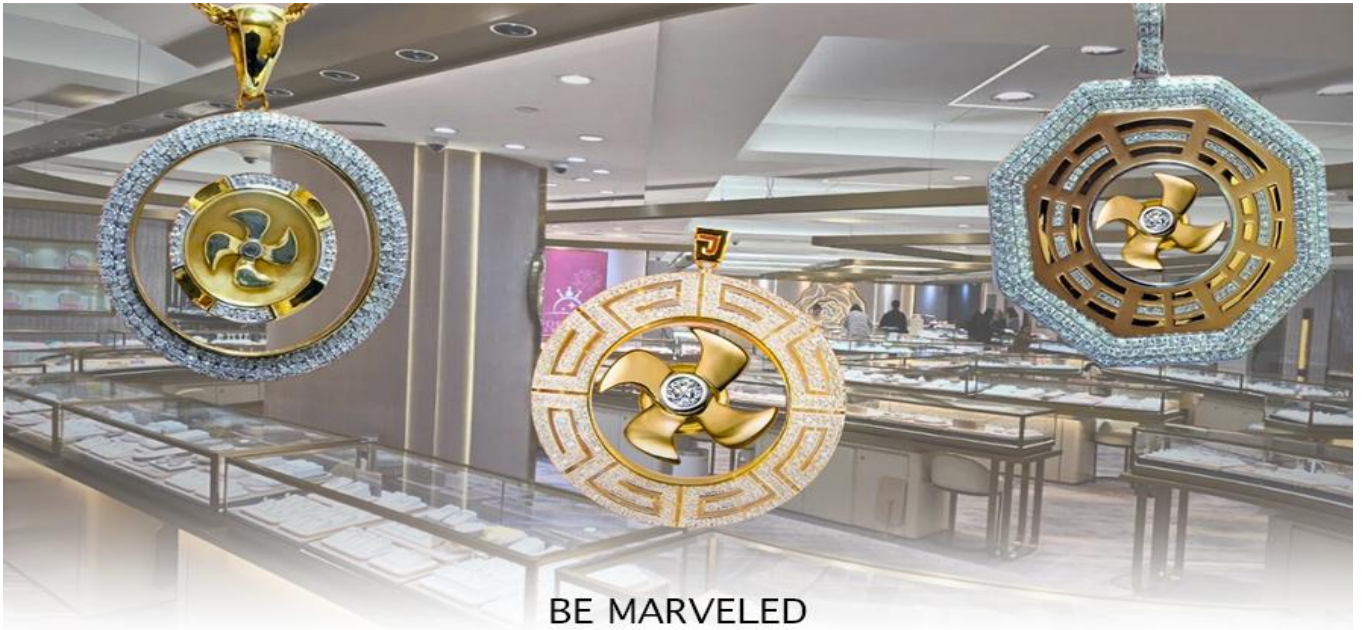
BE MARVELED ศูนย์จิวเวลรี่ กัวฮินนครบุรี

ว่าหยก มงคล ถ้าพกติดตัวไว้จะอายุยืนและสุขภาพดีมีสินค้ำมากมายเกี่ยวกับหยก อาทิ กำไลหยก หรือสัตว์นำโชคอย่างปี่เซ่ยะ ให้ ท่านได้เลือกซื้อเป็นของฝาก, ของที่ระลึก หรือของนำโชคแต่ตัวท่านเอง