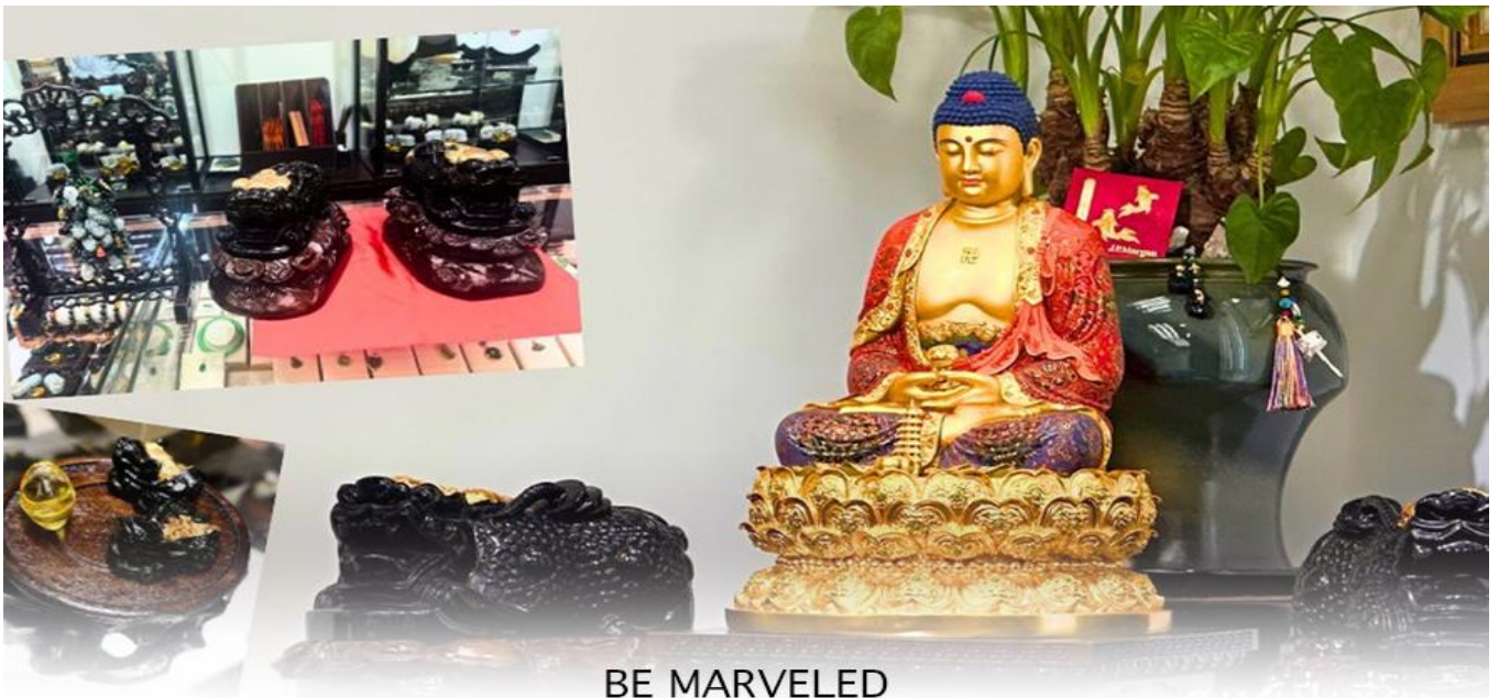
BE MARVELED ศูนย์ปี่เซ่ยะ