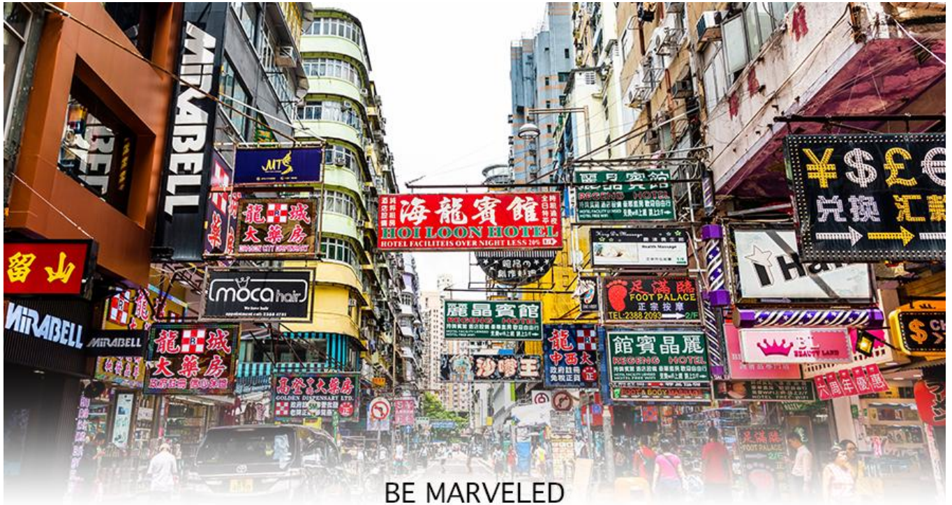
BE MARVELED MONGKOK

เครื่องสำอาง รองเท้า กระเป๋า เครื่องประดับมากมาย อีกทั้งยังมีร้านอาหาร และเครื่องดื่ม ที่ขึ้นชื่อหลากหลายชนิด ให้ทุกท่านได้ลองลิ้มรสอีกมากมาย