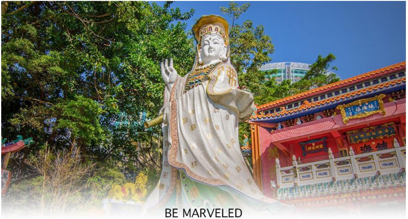
BE MARVELED วัดเจ้าแม่กวนอิมริพลัสเบีย

จากนั้นนำท่านเดินทางสู่ วัดหลินฟ้า (LIN FA KUNG TEMPLE) วัดหลินฟ้ากงอยู่ในย่านหว่านไฉ่ ตั้งอยู่บนเนินเขาหันหน้าออกสู่ทะเลทางทิศตะวันออกเฉียงใต้ของอ่าวคอสเวย์ ถึงแม้จะเป็นวัดเล็ก ๆ แต่วัดหลินฟ้า คือวัดเก่าแก่ที่มีประวัติความเป็นมาเกี่ยวข้องกับความศักดิ์สิทธิ์ของเจ้าแม่กวนอิมโดยตรงวัดนี้ตั้งอยู่บนถนนลิลี สตรีท (Lily St.) ที่เชื่อมต่อกับถนน Lin Fa Kung ตามชื่อวัดหลินฟ้า ตำนานเล่าว่า ในสมัยราชวงศ์ซิง เจ้าแม่กวนอิม หรือพระโพธิสัตว์กวนอิม ซึ่งเป็นเทพีแห่งความเมตตา ได้ปรากฏกายขึ้นบนโขดหินรูปดอกบัว (Lotus Rock) ณ บริเวณที่ตั้งของวัดในปัจจุบัน ชาวบ้านเชื่อว่าการปรากฏกายของเจ้าแม่กวนอิมเป็นสัญลักษณ์ของความโชคดีและการคุ้มครองจากภัยพิบัติต่างๆ จากจุดนี้ เราสามารถเดินเล่นเดินเที่ยวต่อไปยังถนนเส้นอื่น ๆ ได้ง่าย ตลอดเส้นทาง ทำให้วัดหลินฟ้า หรือ หลินฟ้ากง (Lin Fa Kung) แห่งนี้ อยู่ในจุดที่นักท่องเที่ยวสามารถเข้ามาไหว้ขอพรเจ้าแม่กวนอิมวังดอกบัวได้สะดวก