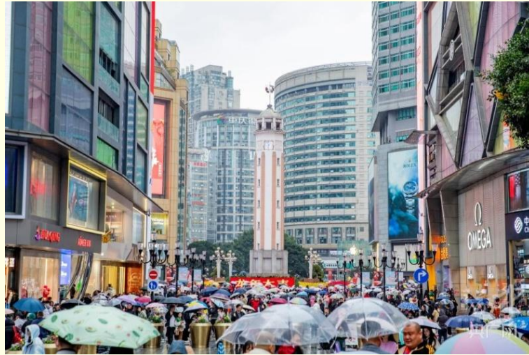
ถนนคนเดินเจี๋ยฟางเป่ย์

และนำท่านไป ถนนคนเดินเจี๋ยฟางเป่ย์ (Jiefangbei Street) ตั้งอยู่บริเวณอนุสาวรีย์ปลดแอก ซึ่งสร้างขึ้นเพื่อรำลึกถึงชัยชนะในการทำสงครามกับญี่ปุ่น แต่ปัจจุบันกลายเป็นศูนย์กลางทางการค้าขนาดใหญ่ ใจกลางเมือง เต็มไปด้วยร้านค้ามากกว่า 3,000 ร้าน ซึ่งมีทั้งอาหาร ซ้อปิ้ง มอลล์ขนาดใหญ่ ให้ท่านได้เดินชมและซ้อปิ้งกันอย่างจุใจ.