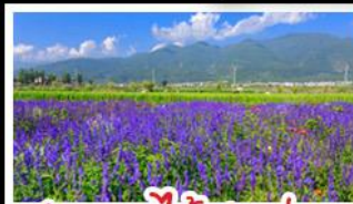
สวนดอกไม้ฮาวอวูมีฉ่าง