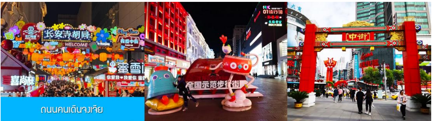
ถนนคนเดินจางเจีย

จากนั้นนำท่านเดินทางสู่ เมืองเสิ่นหยาง 沈阳市