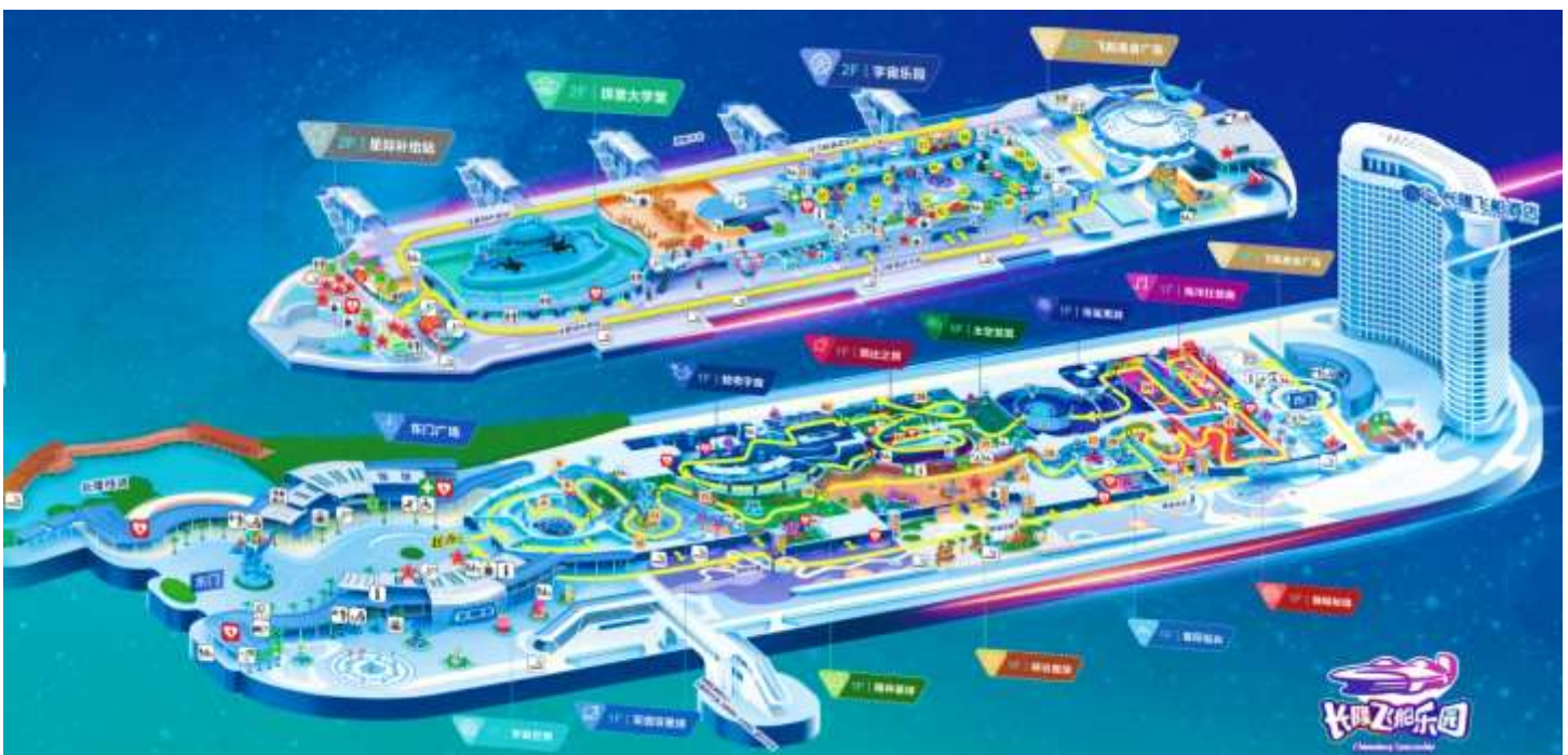
แผนที่ CHIMELONG SPACESHIP PARK