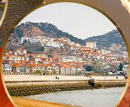
ซาจี้โข่ว