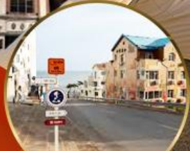
ถนนอ่าวจีป่า