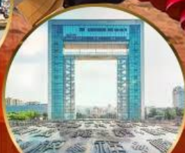
ประตูแห่งความสุข

SC4080 02.05-08.05 SC4079 21.50-01.55 เดินทางด้วยสายการบิน Shandong Airline (SC) น้ำหนักกระเป๋า 23 Kg. Carry on 5 Kg.