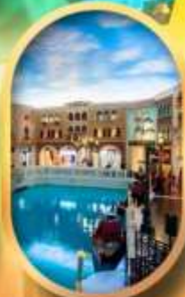
เดอะเวนิเซียน