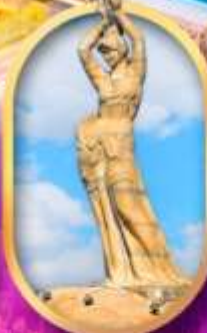
เด็กหญิงชาวประมง