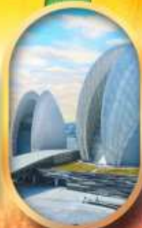
โรงละครไข่มุก