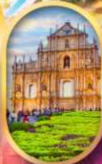
โบสถ์เซนต์พอล