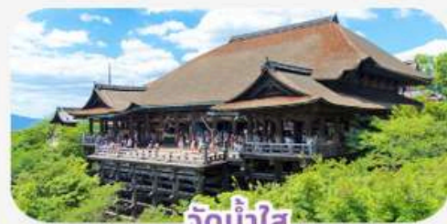
วัดน้ำใส