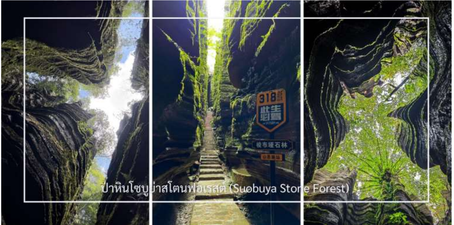
ป่าหินโซบูย่าสโตนฟอเรสต์ (Suobuya Stone Forest)

หลังอาหารเช้านำท่านสู่ ป่าหินโซบูย่าสโตนฟอเรสต์ (Suobuya Stone Forest) แหล่งท่องเที่ยวทางธรรมชาติอันน่ามหัศจรรย์ ซึ่งโดดเด่นด้วยกลุ่มหินปูนรูปร่างแปลกตาที่ก่อตัวขึ้นตามธรรมชาติเป็นเวลานับล้านปี ภายในพื้นที่เต็มไปด้วยเสาหินสูงตระหง่านเรียงรายสลัซับซ้อน เปรียบเสมือนป่าที่สร้างขึ้นจากหิน ผสานกับบรรยากาศร่มรื่นและเงียบสงบ เหมาะแก่การเดินทางชมธรรมชาติและเก็บภาพความประทับใจตลอดเส้นทาง