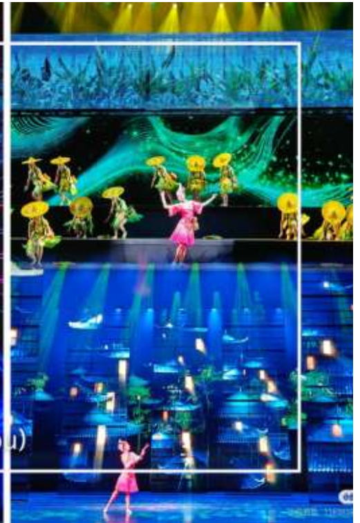
การแสดงโชว์ซีลิ่งคาปู (Xilan Kapu)

เดินทางเข้าโรงแรมที่พัก Xiazhou Hotel ระดับ 4 ดาวหรือเทียบเท่า