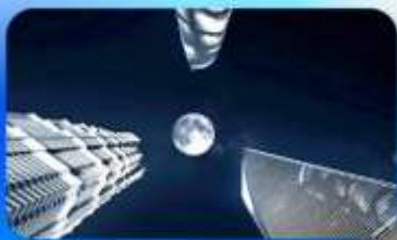
ลู่อิจัยσύ