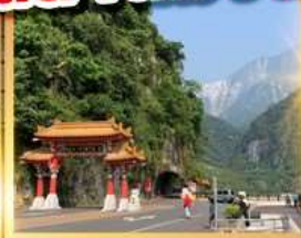
อุทยานทาโรโกะ