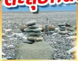
หาดซีชิง

เดินชมวิวเกาะเหอผิง ตะลุยกินตลาดมิชลินที่เราหา