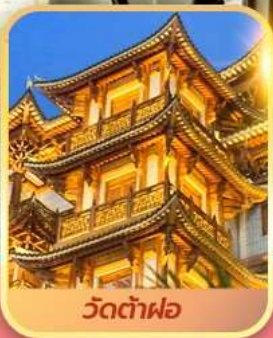
วัดต้าฟอ