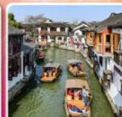
หมู่บ้านโบราณซูเจียเจี๋ย