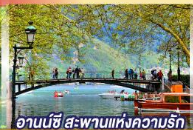
อานันชี สะพานแห่งความรัก