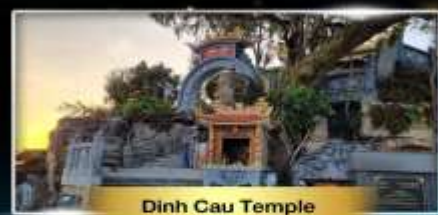
Dinh Cau Temple