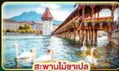
สะพานไม้อาเล