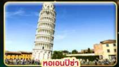
หออนพีซ่า