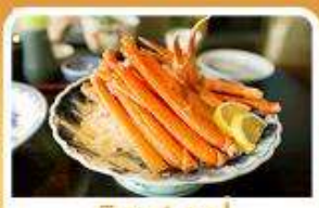
พิเศษ! ชาปู