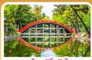
ศาลเจ้าสุมิโยชิ โกเบ